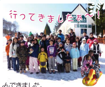
行ってきましたあ〜!

去る2月26日、白樺湖へ1泊2日の日程でスキーツアーに行ってきました。 両日ともに快晴で、みなさん思う存分スキーやスノボ、そり、雪遊びなどを楽しんできました。 特に、スキーをしたことのない子供たちが、1日目にはスキー板を履くところからのスタートだったにも関わらず、2日目にはリフトに乗って斜面を気持ちよさそうに滑ってくる様子に、『さすが子供は覚えがはやいな。』と感心しました。それにひきかえ自分は・・・情けない限りでした(´_ゝ)ガスン また夕食後には、『聖徳太子ゲーム』という3人が違う言葉で大きな声で言い、その言葉を聞き分けるというレクリエーションが行われ、正解者には景品が配られました。大人も子供も楽しく盛り上がりました。 あっという間に2日間が過ぎてしまいましたが、大きな事故もなく無事に帰宅する事ができ、みなさんにとって思い出深い冬の出来事となったのではないのでしょうか。