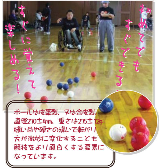
ボールは皮革製、又は合皮革製。直径270±4mm、重さは275±2g。縫い目や硬さの違いで転がりが微妙に変化することも競技をより面白くする要素になっています。

日本では1997年に日本ポッチャ協会の発足後、全国各地で講習会や大会等が実施され、近年では、2008年の北京パラリンピックに初出場するなど、各地域で重度障害者のスポーツとして普及し、盛んに行われています。